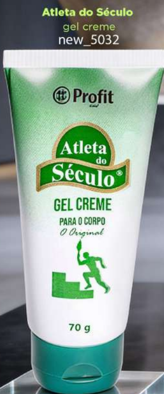
Atleta do Século gel creme new_5032