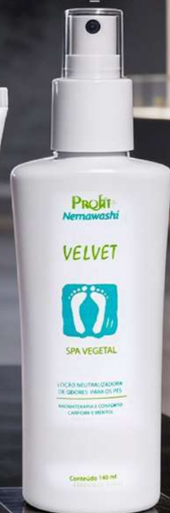
Velvet Absorvedor de Odores new_5014