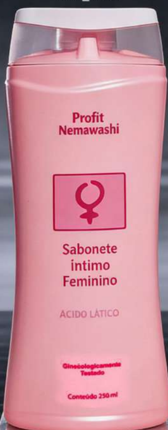
Sabonete íntimo feminino new_5005