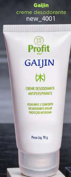
Gaijin creme desodorante new_4001