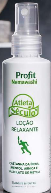
Atleta do Século loção relaxante new_5001